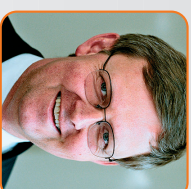
Ulrich v. Kirchbach